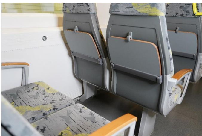
Bild 3: Jeder Sitzplatz in der zweiten Klasse ist künftig mit einem Klapptisch ausgestattet.