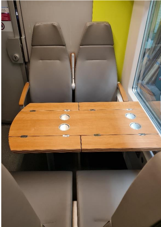
Bild 1: Die Sitze in der ersten Klasse sind mit nachhaltigem E-Leather bezogen.